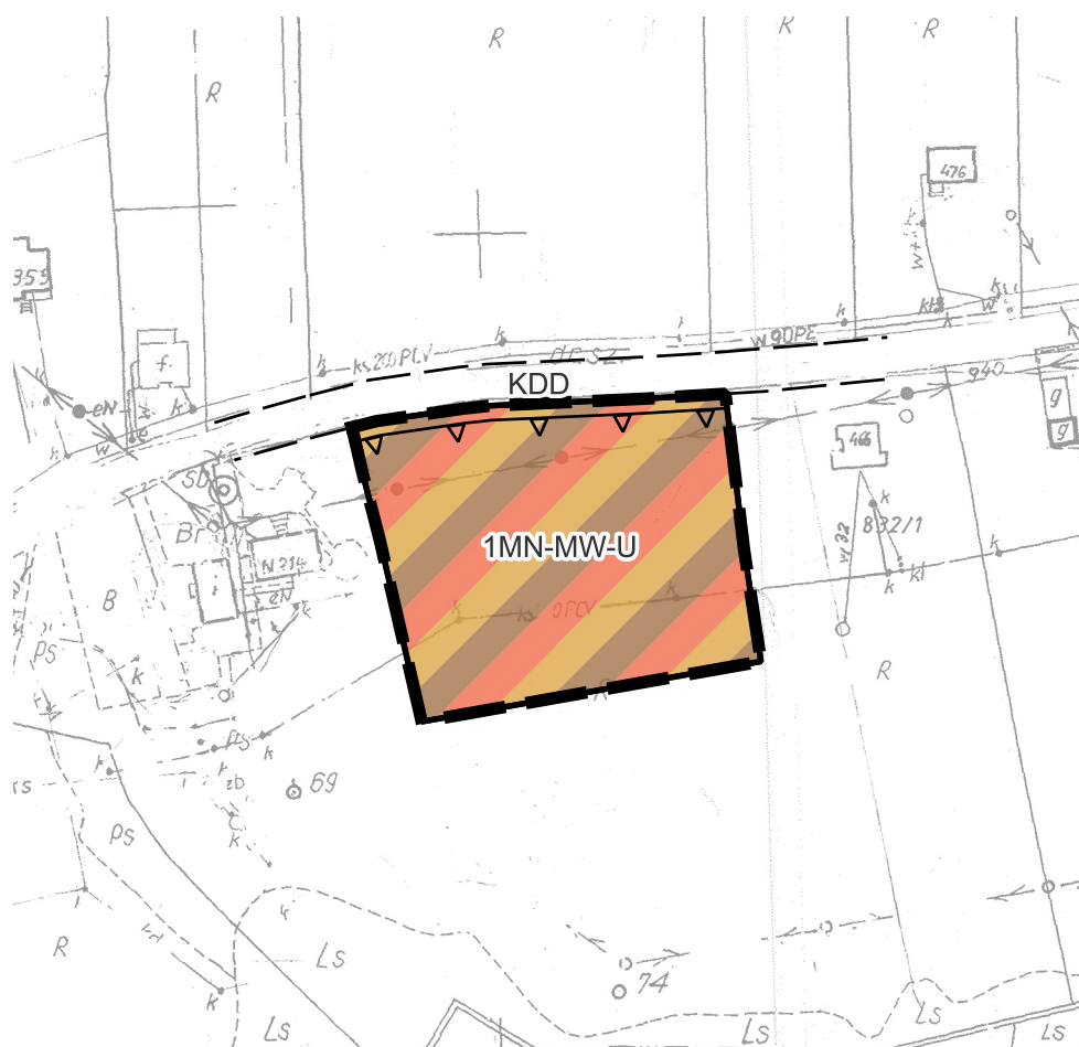
GMINA KORZENNA, MIEJSCOWOŚĆ KORZENNA - TEREN 1MN-MW-U