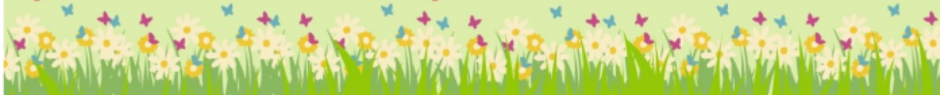
Plakat o rekrutacji do przedszkola