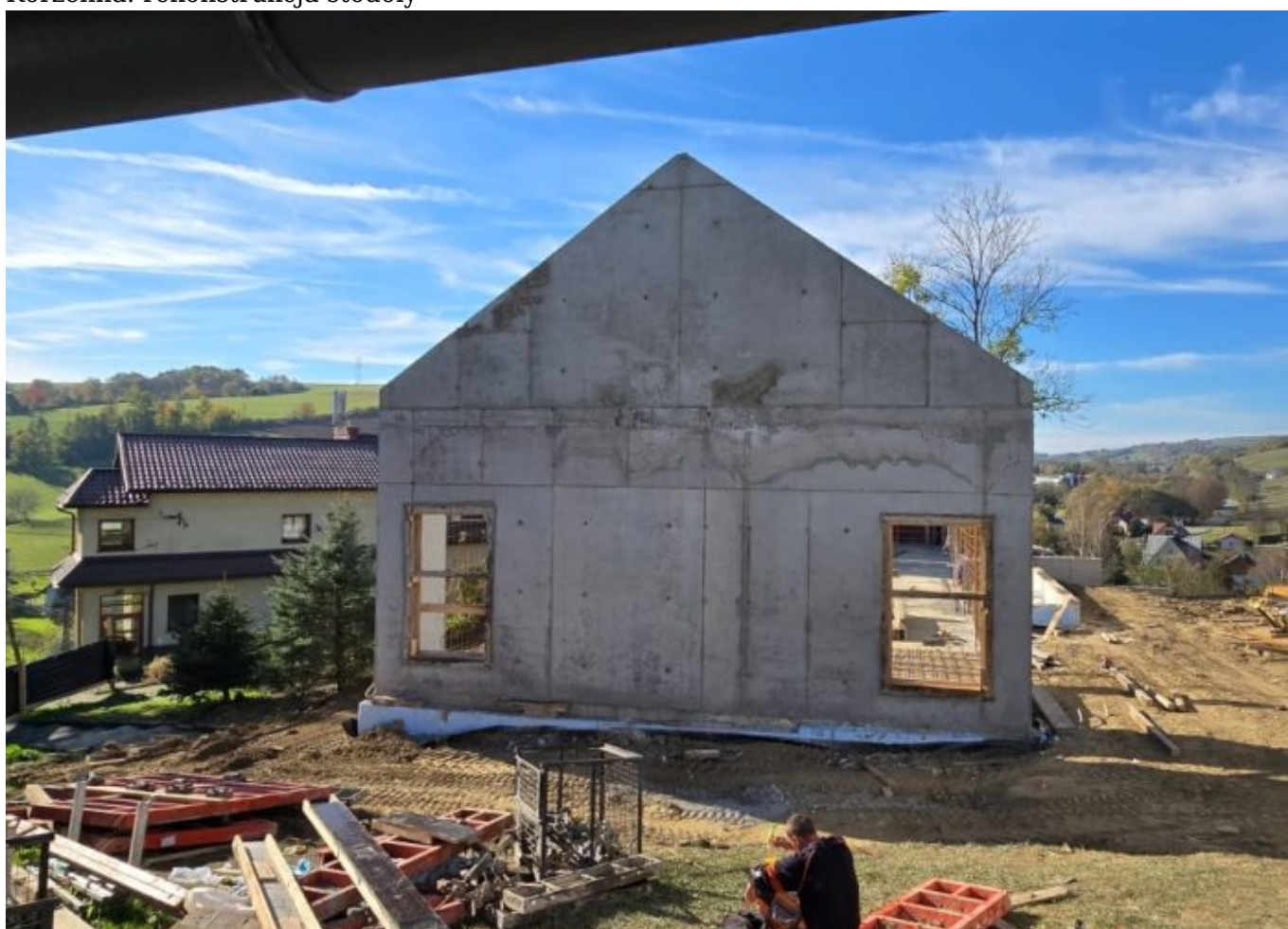
Korzenna: rekonstrukcja stodoły