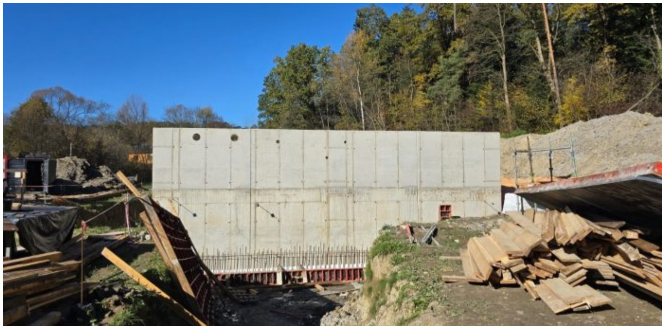
Łęka: budowa oczyszczalni ścieków