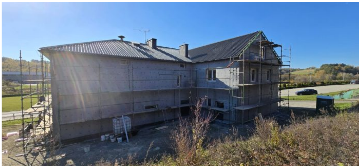
Wojnarowa: termomodernizacja remizy