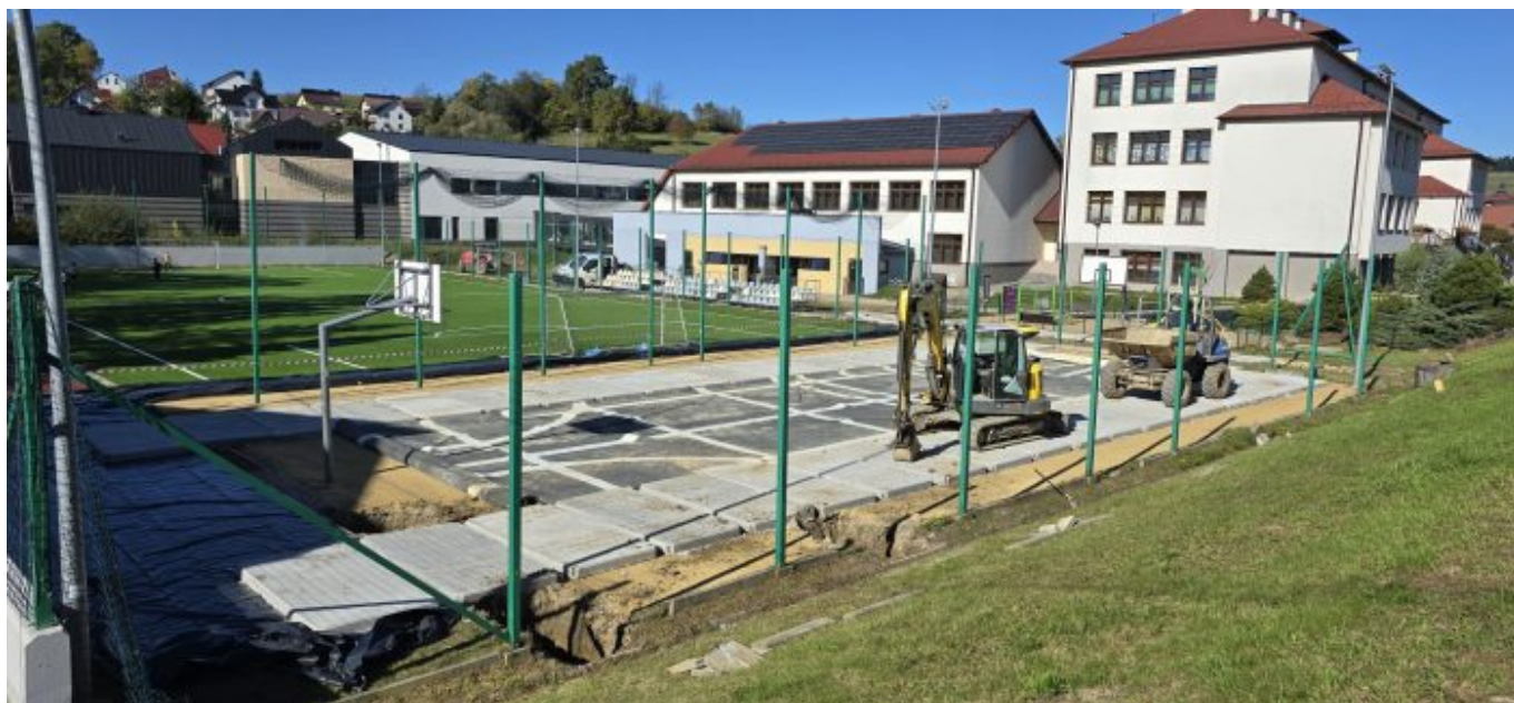
Korzenna: zadaszenie boiska

Z kolei w Wojnarowej budynek remizy jest poddawany termomodernizacji. W efekcie poprawi się jego estetyka, a zapotrzebowanie na energię ciepłą spadnie. Zmniejszą się w konsekwencji koszty jego utrzymania. Wydatki na tę inwestycję przekoczą 700 tys. zł, a finał prac ma nastąpić w tym roku.