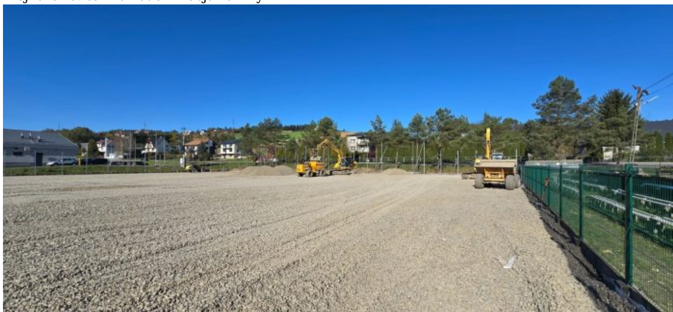
Korzenna: wymiana nawierzchni boiska