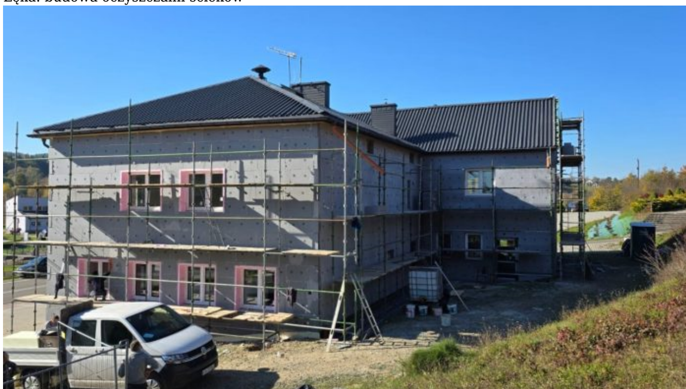
Wojnarowa: termomodernizacja remizy