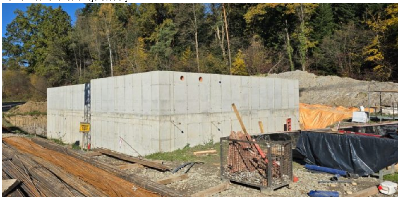
Łęka: budowa oczyszczalni ścieków