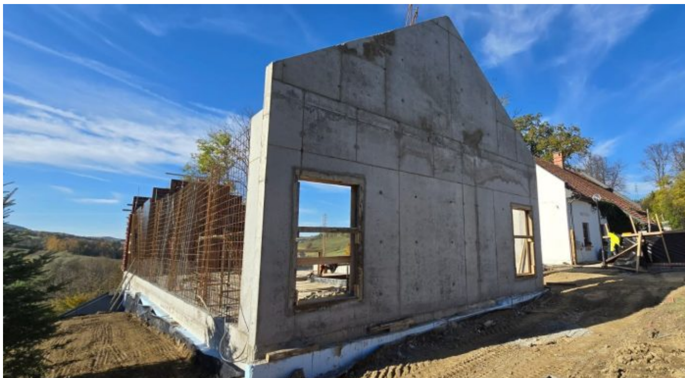
Korzenna: rekonstrukcja stodoły