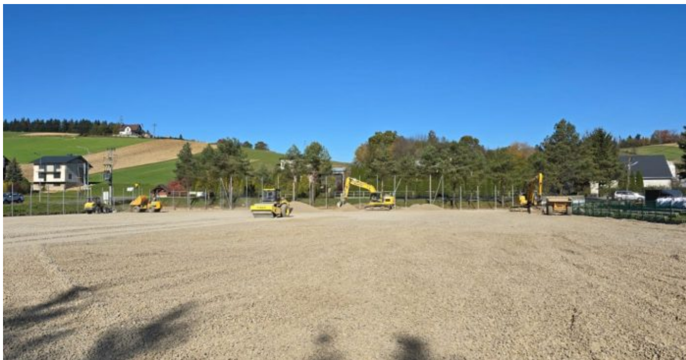
Korzenna: wymiana nawierzchni boiska

Tagi: Korzenna , Wojnarowa , ekologia , inwestycje , lodowisko , oczyszczalnia ścieków , piłka nożna , rozwój , sala koncertowa , sztuczna nawierzchnia , termomodernizacja , Łęka